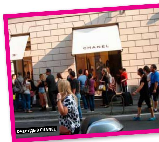
ОЧЕРЕДЬ В CHANEL