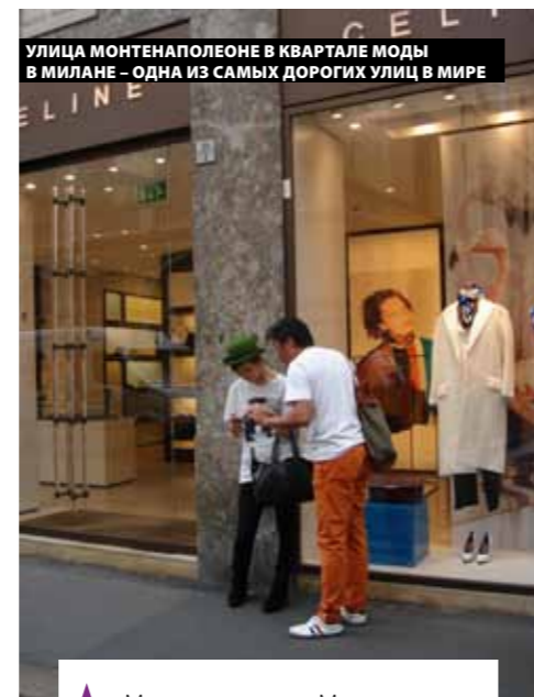
УЛИЦА МОНТЕНАПОЛЕОНЕ В КВАРТАЛЕ МОДЫ В МИЛАНЕ – ОДНА ИЗ САМЫХ ДОРОГИХ УЛИЦ В МИРЕ

Италия. Милан. Fashion. Или как просто стать fashionista, находясь в Италии