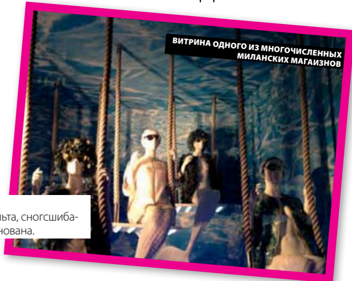
ВИТРИНА ОДНОГО ИЗ МНОГОЧИСЛЕННЫХ МИЛАНСКИХ МАГАЗИНОВ

★ Мода в ранге культа, сногшибательна и научно обоснована.