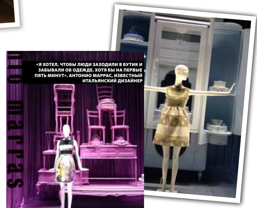
«Я ХОТЕЛ, ЧТОБЫ ЛЮДИ ЗАХОДИЛИ В БУТИК И ЗАБЫВАЛИ ОБ ОДЕЖДЕ. ХОТЯ БЫ НА ПЕРВЫЕ ПЯТЬ МИНУТ». АНТОНИО МАРРАС, ИЗВЕСТНЫЙ ИТАЛЬЯНСКИЙ ДИЗАЙНЕР

★ Воздух насыщен модой. Куда ни глянь, везде глаз радуется и душа трепещет. Витрины магазинов – как современные инсталляции в стиле contemporary art, в магазинах товар меняют каждую неделю, витрины обновляют каждый месяц.