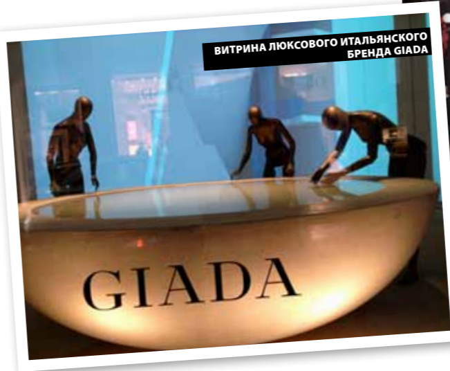
ВИТРИНА ЛЮКСОВОГО ИТАЛЬЯНСКОГО БРЕНДА GIADA

Царство моды – Италия. Быть в Милане – стать fashionista! Это легко и просто.