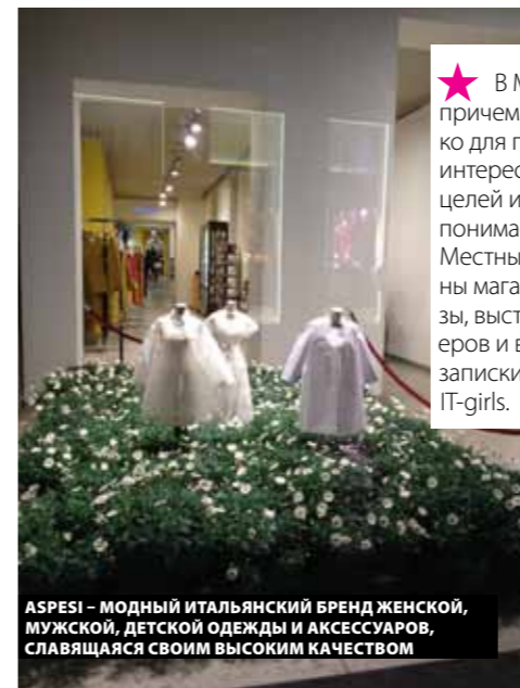
ASPEI – МОДНЫЙ ИТАЛЬЯНСКИЙ БРЕНД ЖЕНСКОЙ, МУЖСКОЙ, ДЕТСКОЙ ОДЕЖДЫ И АКСЕССУАРОВ, СЛАВЯЩАЯСЯ СВОИМ ВЫСОКИМ КАЧЕСТВОМ

★ У итальянцев новаторство в крови, а культом матери и любовью пропитано все земное. Этим темпераментным жителям планеты Земля принадлежат первые мире академии искусства, первые автомагистрали, первые страховые полисы... Но самым важным для любого итальянца будет паста, масло из оливок, кофе и вино. Путешествуя в другие страны, они непременно поместят все это в свой чемодан.